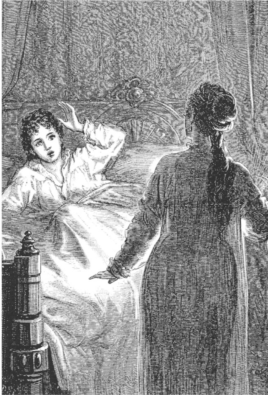
Ilustración de David Henry Friston para la primera edición de Carmilla en la revista The Dark Blue , 1872.