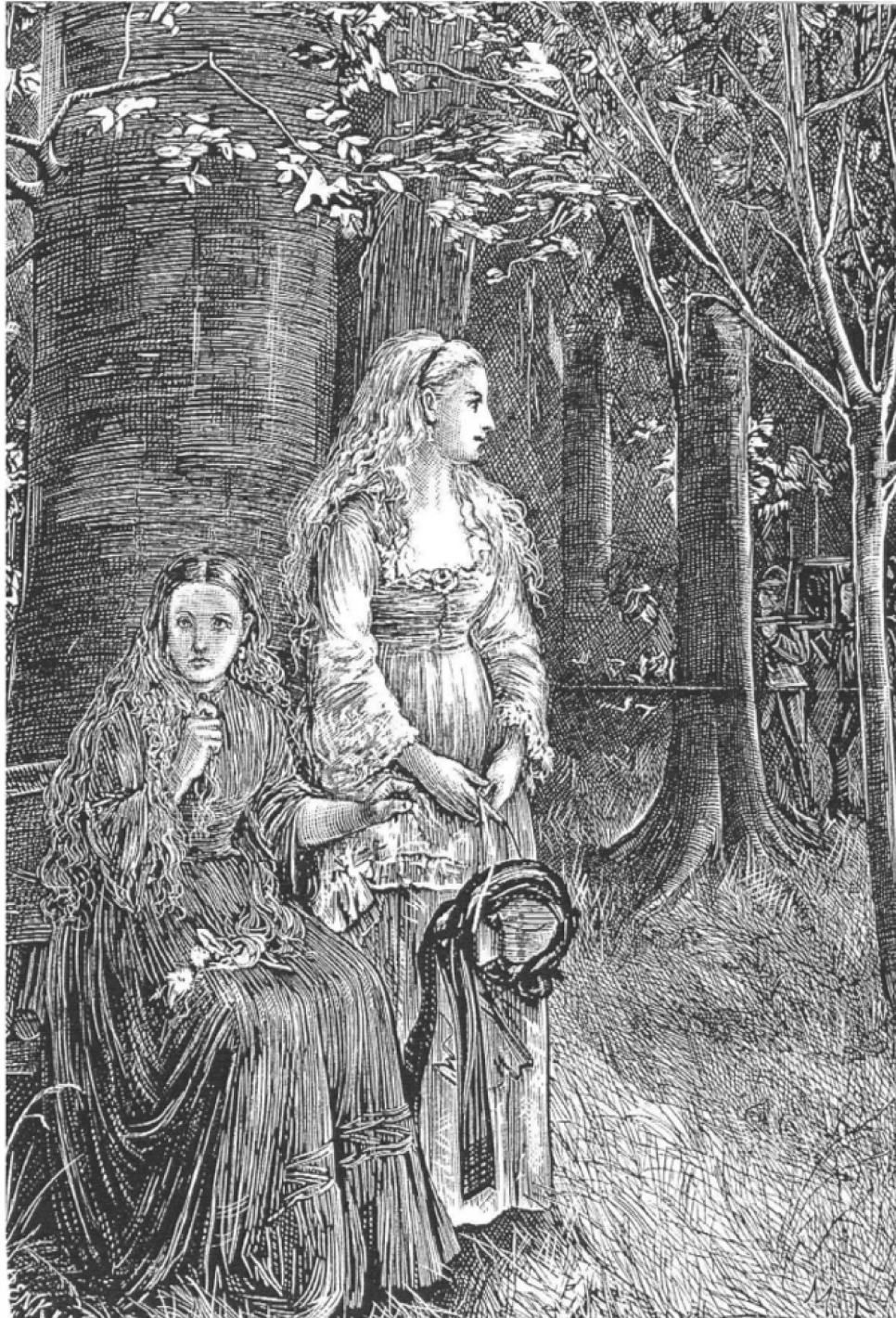
Ilustración de Michael Fitzgerald para la primera edición de Carmilla en la revista The Dark Blue , 1872.