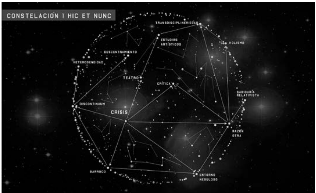
Ilustración 1. Constelación Hic et Nunc

Elaboración propia. Diseño: Felipe Vélez.