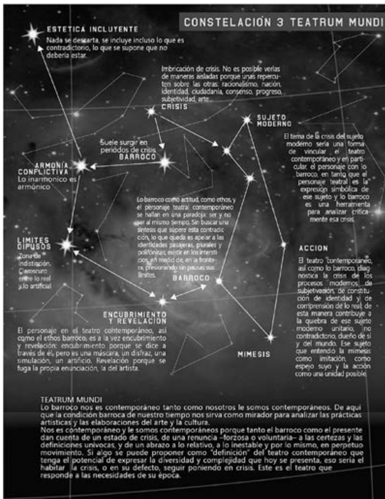
Ilustración 3. Constelación Teatrum Mundi

Elaboración Propia. Diseño: Felipe Vélez.